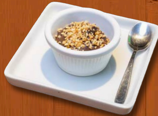
Brigadeiro de colher