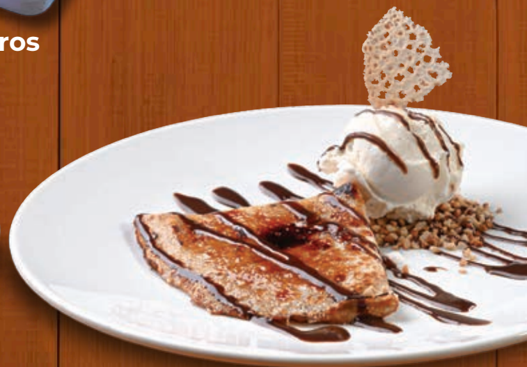
Crepe brûlée dulce de leite

Crepe recheado de doce de leite, sorvete de creme e calda de Nutella