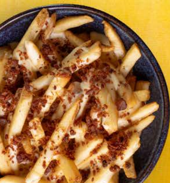
A melhor batata que você já comeu