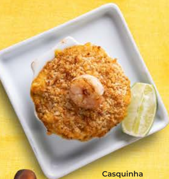
Casquinha de Camarão