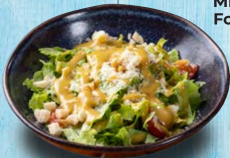
Mix de Folhas