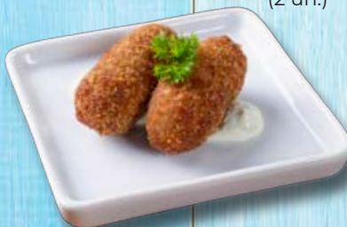
Croquete (2 un.)