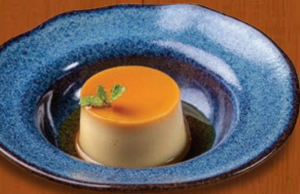
Pudim de leite