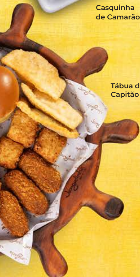
Tábua do Capitão