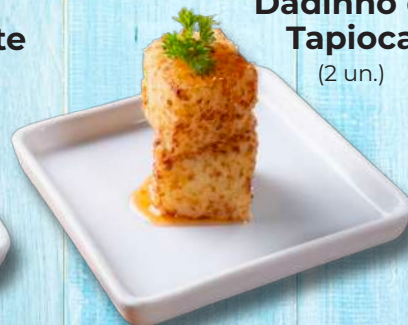
Dadinho de Tapioca (2 un.)