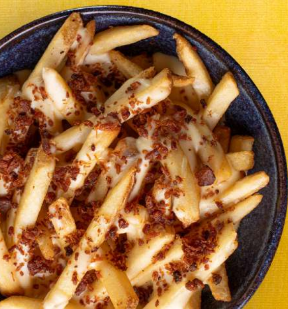
A melhor batata que você já comeu