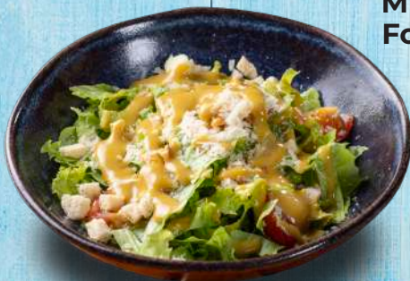
Mix de Folhas