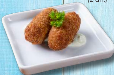
Croquete (2 un.)