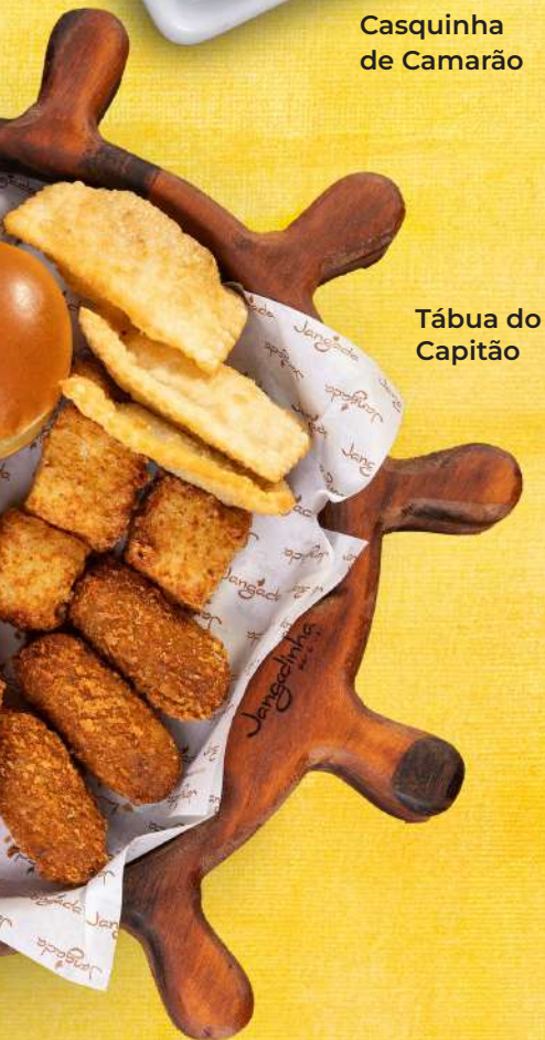
Tábua do Capitão