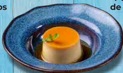
Pudim de leite