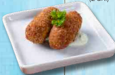
Croquete (2 un.)