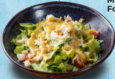
Mix de Folhas