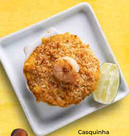
Casquinha de Camarão