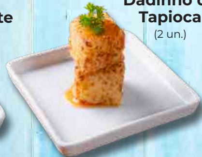
Dadinho de Tapioca (2 un.)