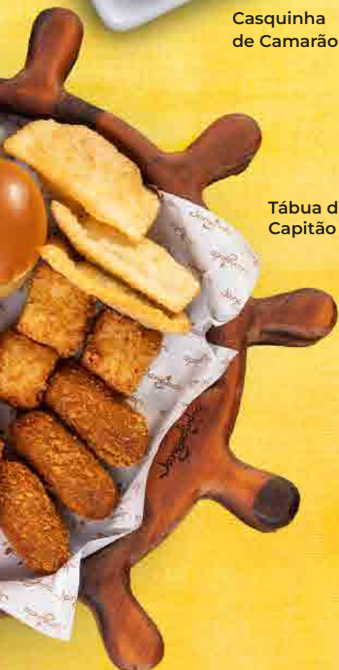
Tábua do Capitão