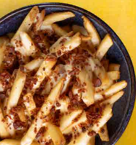
A melhor batata que você já comeu