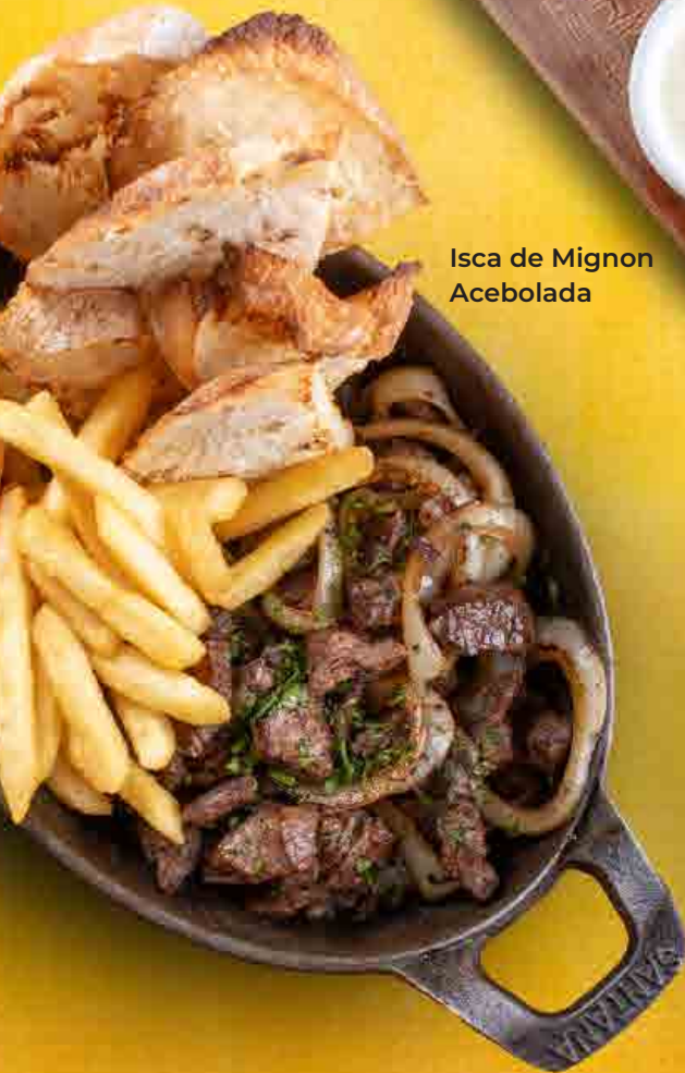
Isca de Mignon Acebolada