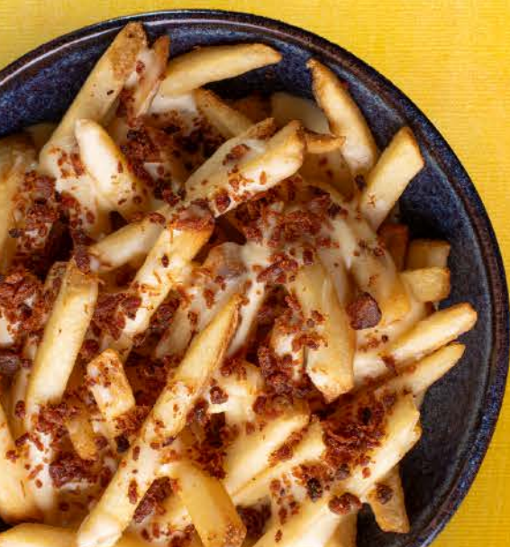
A melhor batata que você já comeu