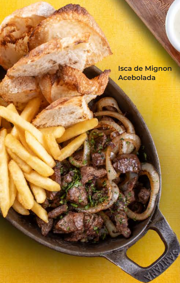
Isca de Mignon Acebolada