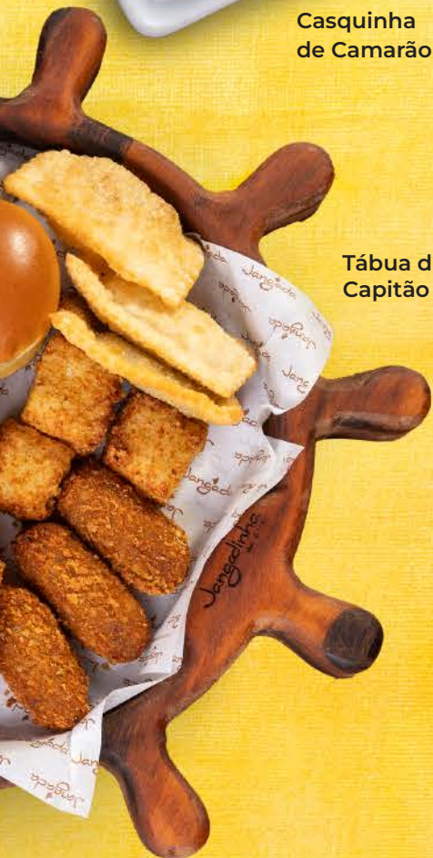
Tábua do Capitão