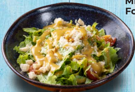
Mix de Folhas