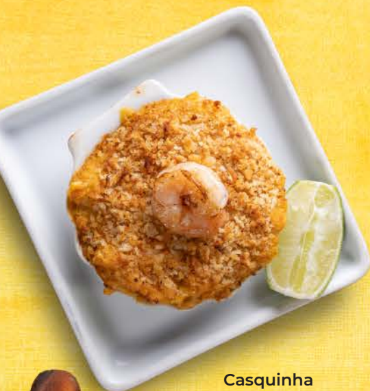
Casquinha de Camarão