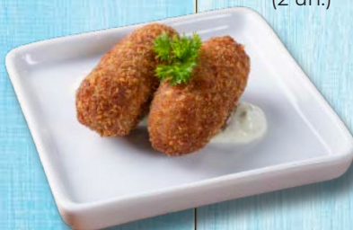
Croquete (2 un.)