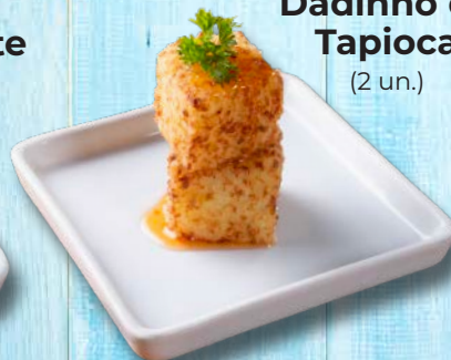
Dadinho de Tapioca (2 un.)