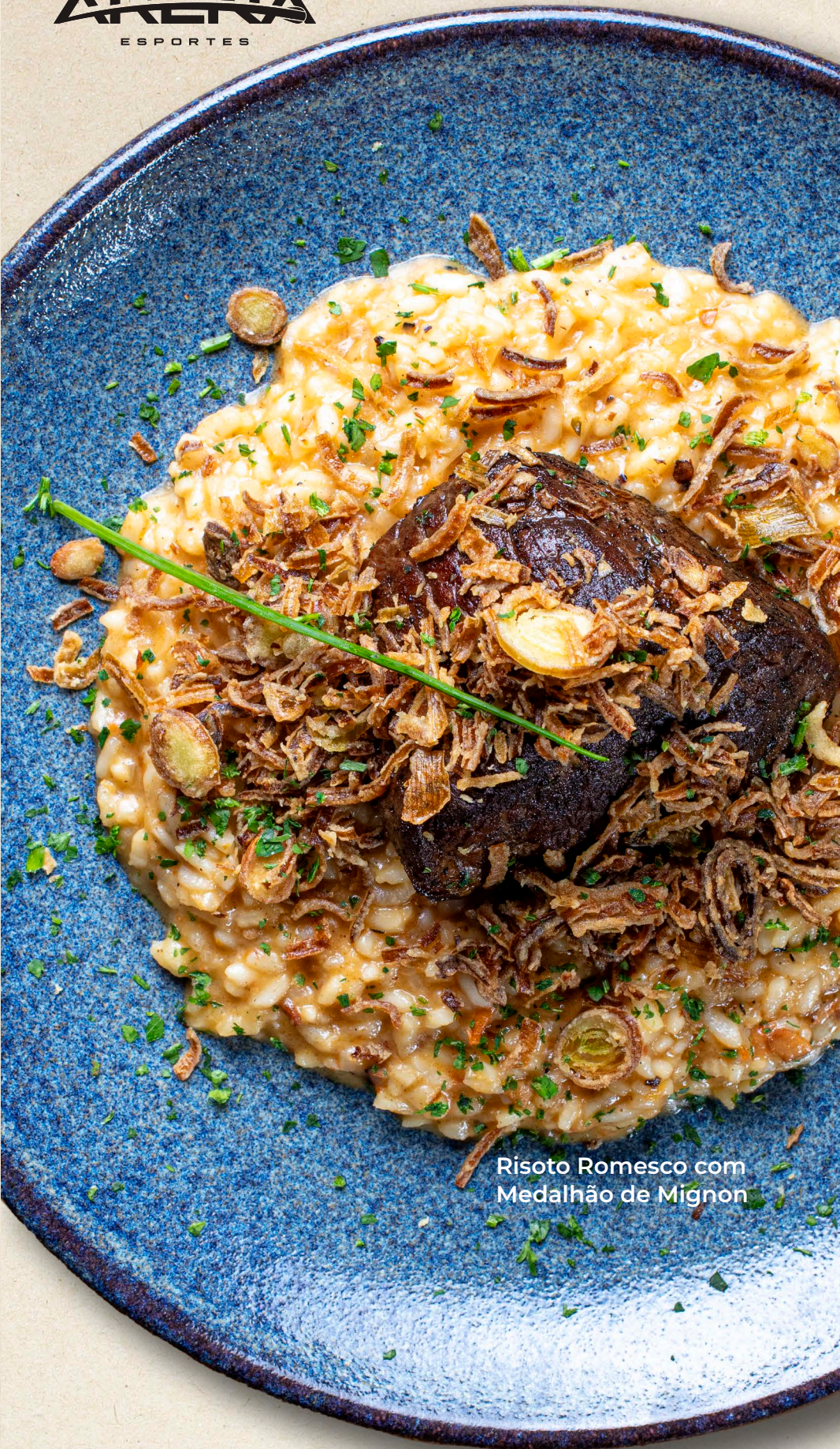
Risoto Romesco com Medalhão de Mignon